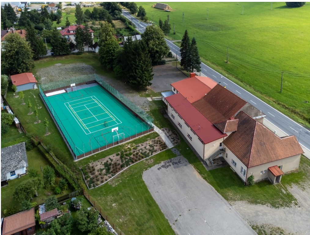
Multifunkční hřiště za sokolovnou