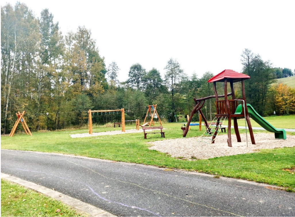
Dětské hřiště u rybníku Šišmák