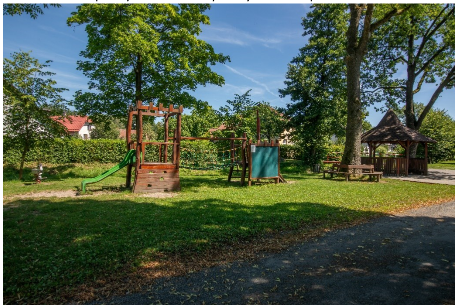
Dětské hřiště u hasičské zbrojnice

Nynější podmínky a zázemí pro rozvoj sportu ve Vojnově Městci tvoří multifunkční hřiště, fitness prvky, petánque hřiště a 2 dětská hřiště. Zázemím pro rozvoj sportu zajišťuje také sokolovna ve vlastnictví Česká obec sokolská. Od roku 1991 v sokolovně působí TJ Jiskra Vojnův Městec, která zajišťuje sportovní vyžití pro všechny věkové kategorie. Sokolovna dále slouží místní základní i mateřské škole pro výuku tělesné výchovy a cvičení předškolních dětí.